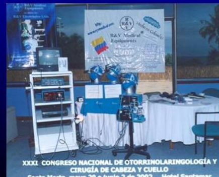
XXXI CONGRESO NACIONAL DE OTORRINOLARINGOLOGÍA Y CIRUGÍA DE CABEZA Y CUELLO