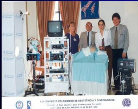
XXXI CONGRESO COLOMBIANO DE OBSTETRICIA Y GINECOLOGIA