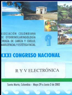
Santa Marta, Colombia - Mayo 29 a Junio 2 de 2002