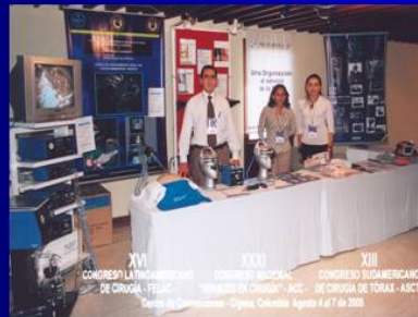
XXXI CONGRESO NACIONAL DE OTORRINOLARINGOLOGÍA Y CIRUGÍA DE CABEZA Y CUELLO