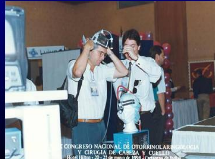
CONGRESO NACIONAL DE OTORRINOLARINGOLOGÍA Y CIRUGÍA DE CABEZA Y CUELLO