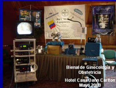
Bienal de Ginecología y Obstetricia Hotel Casa Dahn Carlton Mayo 2003